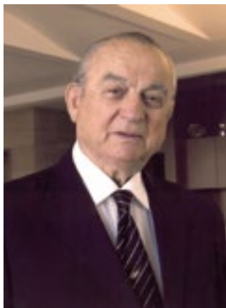
Του Φώτου Ια. Φωτιάδη, Ph.D Λευκωσία, 13 Μαρτίου, 2014

Το casino, ένα διαχρονικό για την Κύπρο αναπτυξιακό όραμα, έχει πλέον τροχοδρομηθεί.